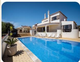
Casas de lujo